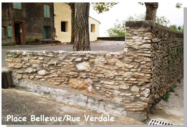
Place Bellevue/Rue Verdale

■ Les peintures sur boiseries du bâtiment hébergeant la bibliothèque seront rafraîchies