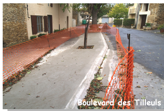
Boulevard des Tilleuls

■ Les grandes vacances ont permis de concentrer les travaux sur l'école : réfection complète du toit de la remise attenante au bâtiment, nettoyage du toit du préau, réparation des chéneaux, installation d'une cloche à l'entrée et élagage des arbres... De quoi accueillir enseignante et élèves dans de bonnes conditions.