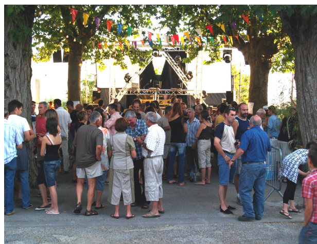
Un air de fête — Apéritif TAPAS 2007

■ Samedi 02 : 19h apéritif tapas et musique bandas - 22h30 Bal animé par le podium PRO-ZIC et son DJ Yann ■ Dimanche 03 : Journée vide greniers - 22h30 Bal animé par le podium PRO-ZIC et son DJ Yann ■ Lundi 04 : 15h Concours local de pétanque - 20h Repas champêtre : Grillades - 22h30 Bal animé par la disco-mobile DANCE MUSIC. Sandwichs et buvette disponibles sur place. Renseignements : Carlip'animations au 06 12 04 01 37 ou sur le site de l'association www.carlipa.net